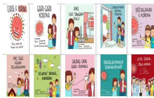
Gambar 2. Seri Edukasi Korona Kemenpppa RI

Adapun 10 seri edukasi korona dari Kemenpppa RI yang dijadikan sampel bacaan dalam penelitian ini yakni : seri 1 (Cerita Si Korona), seri 2 (Gara-gara Korona), seri 3 (Ayo Cuci Tangan Dulu), seri 4 (Jangan Masuk Rumah, Korona!), seri 5 (Perjalanan Si Korona), seri 6 (Ayo Jaga Hewan Peliharaanmu), seri 7 (Selamat Datang, Ramadan), seri 8 (Saling Sapa dari Rumah), seri 9 (Pakailah Masker dengan Benar), seri 10 (Kita Semua Pahlawan).